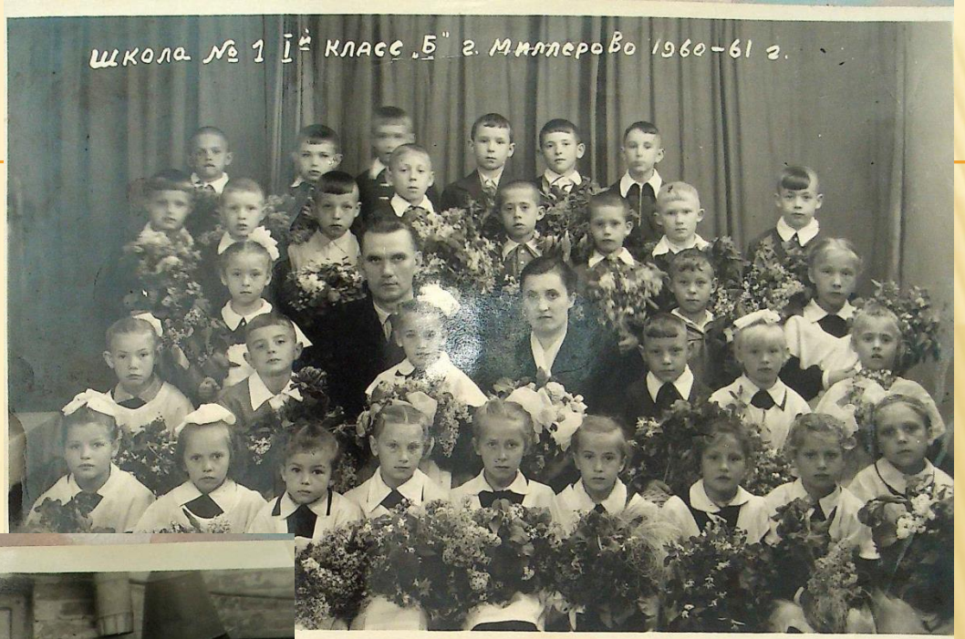
Школа № 1 1 й класс „Б“ г. Миллерово 1960-61 г.